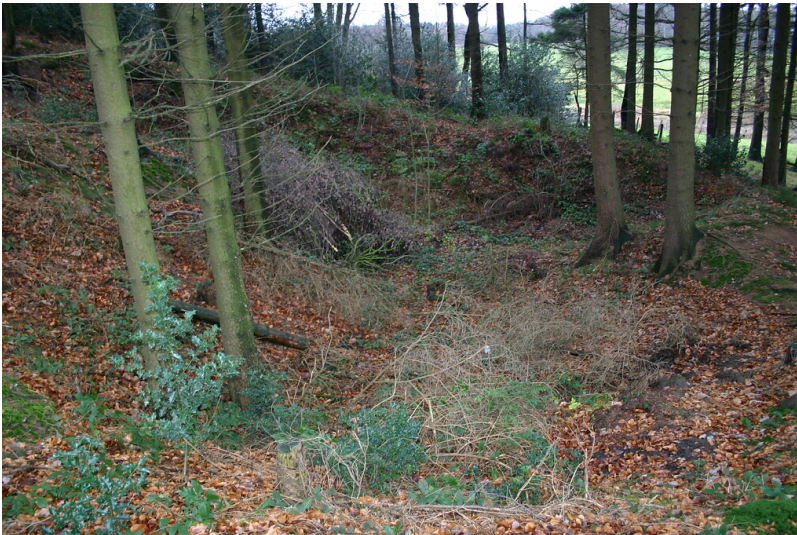
Südlich von Milspe befinden sich in einem bewaldeten Stück Steinbrüche, Steinkuhlen und Halden (2008).