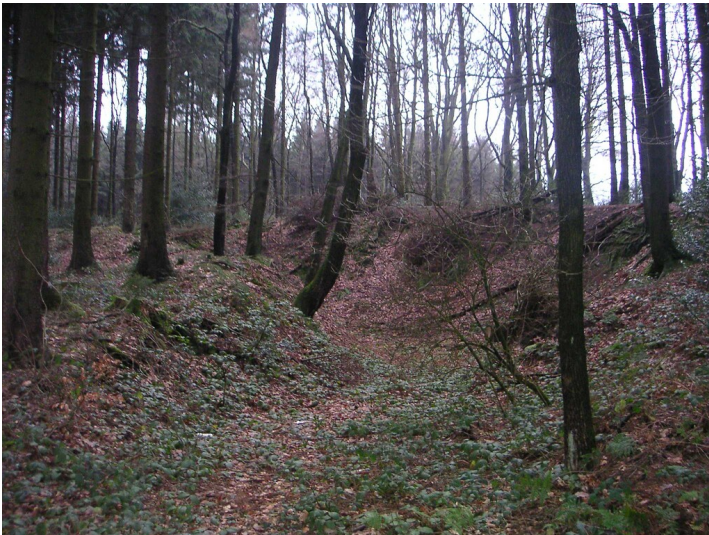
Steinbruch zwischen Finkensiepen und Schmittensiepen im Wald (2008)