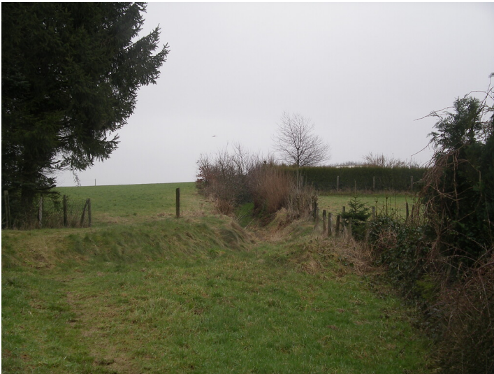
Hohlweg bei Berg (2008)