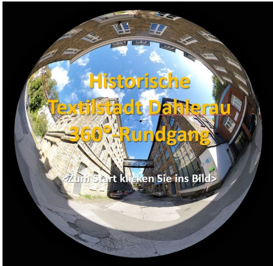
Startbild_360Grad Rundgang Dahlerau (2024)