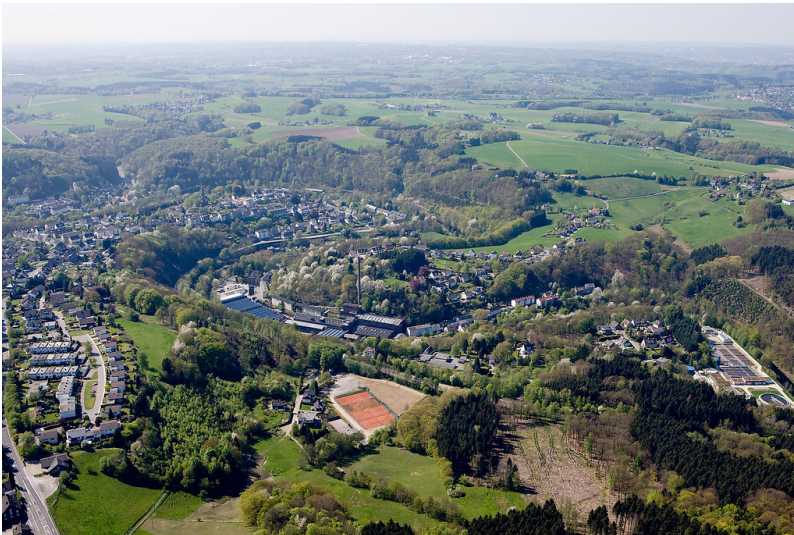
Wupperschleife Dahlerau mit Wülfingmuseum (Mitte), Radevormwald (2009)