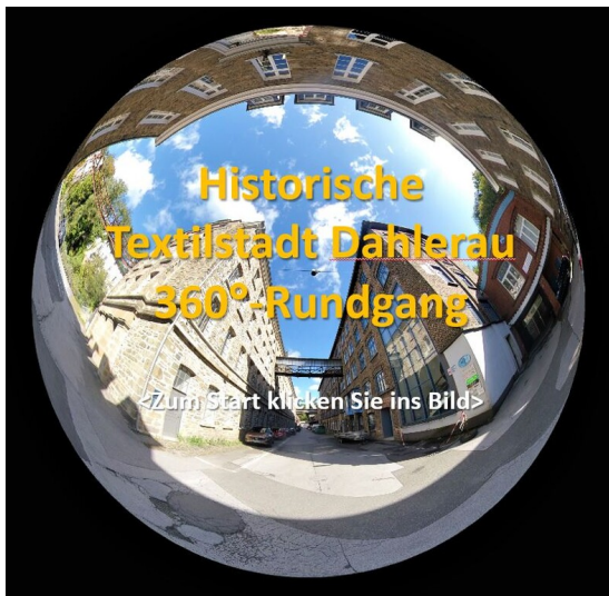
Startbild_360Grad Rundgang Dahlerau (2024)