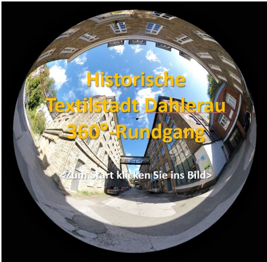
Startbild_360Grad Rundgang Dahlerau (2024)