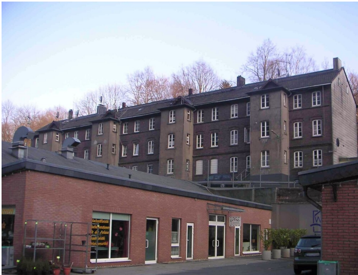
Arbeiterwohnhäuser Vogelsmühle 2-5 (2008)