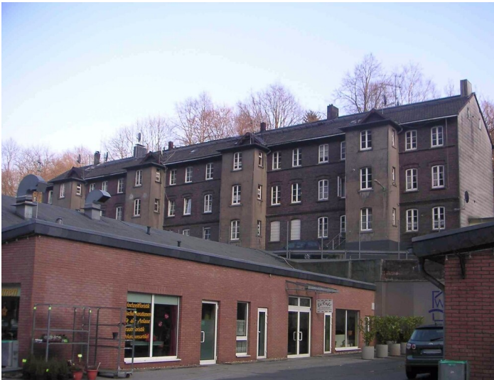
Arbeiterwohnhäuser Vogelsmühle 2-5 (2008)