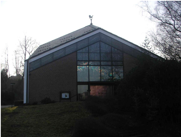
Katholische Kirche Sankt Josef in Vogelsmühle (2008)