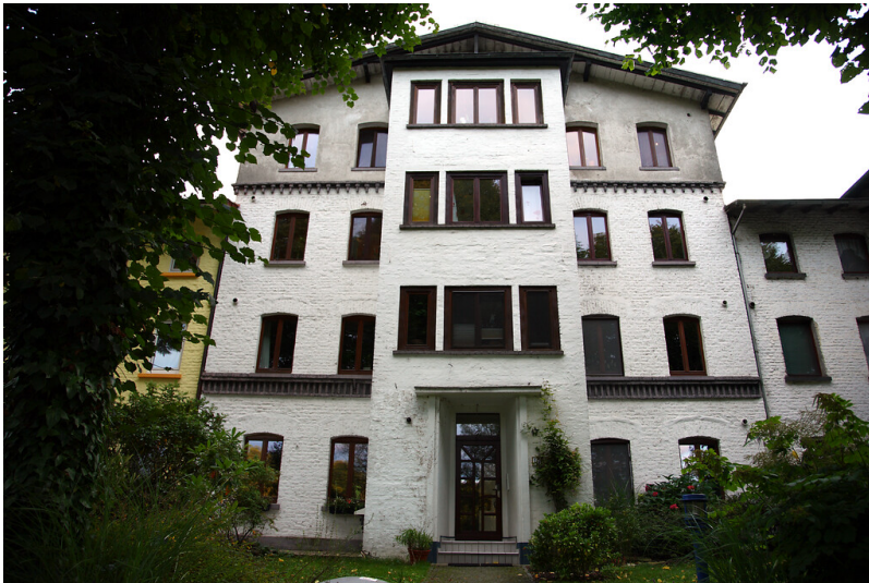
Viergeschossiges Arbeiterwohnhaus der Fabrikanlage Wilhelmstal (2008)