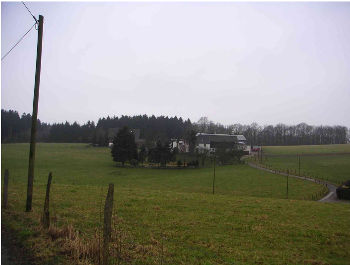
Blick auf die Siedlung Espert von Osten (2008)