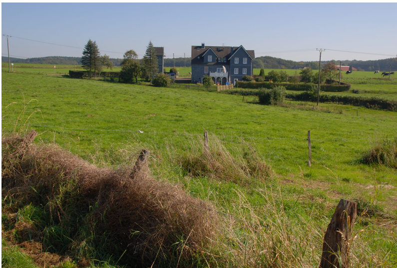
Blick auf Langenkamp von Westen (2008)