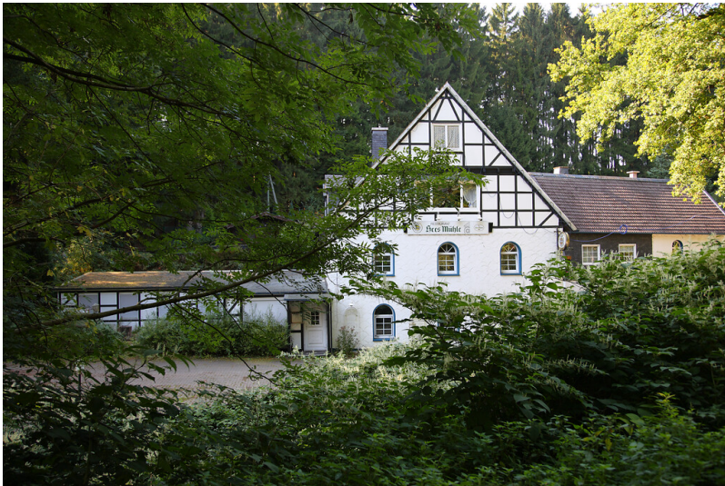
Blick auf die Unterste Mühle im Uelfetal (2008)