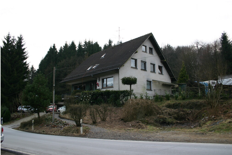
Auf dem Standort der ehemaligen Mühlenanlage in Erlenbach stehen heute modernere Gebäude (2008)