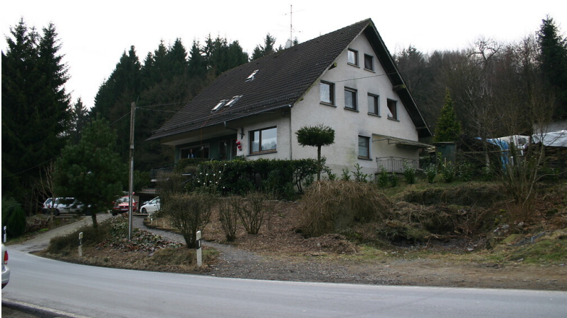
Auf dem Standort der ehemaligen Mühlenanlage in Erlenbach stehen heute modernere Gebäude (2008)