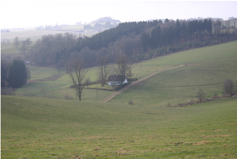
Die Einzelsiedlung Hönderbruch ist umgeben von Grünland (2008)