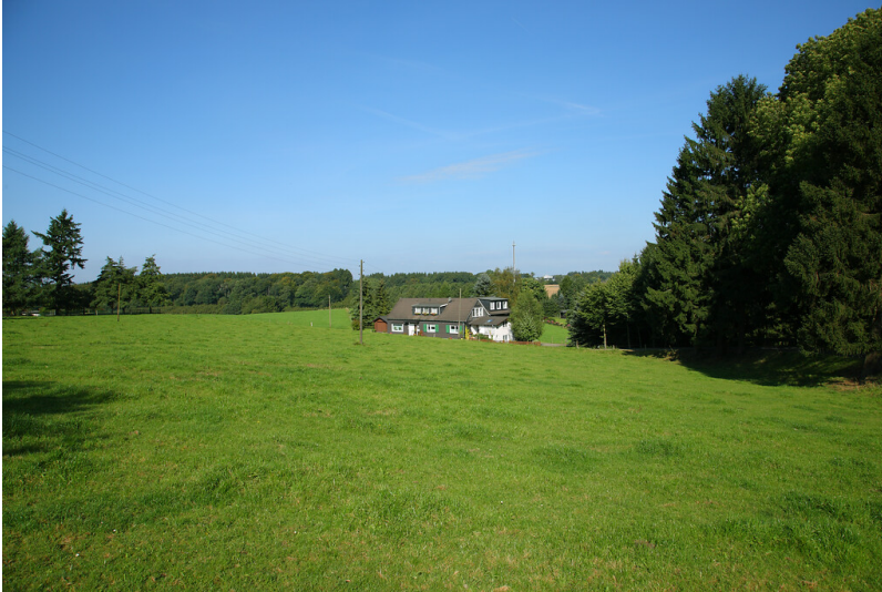
Wohnhaus in Hahnenberg (2008)