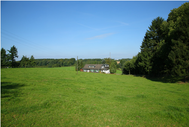
Wohnhaus in Hahnenberg (2008)