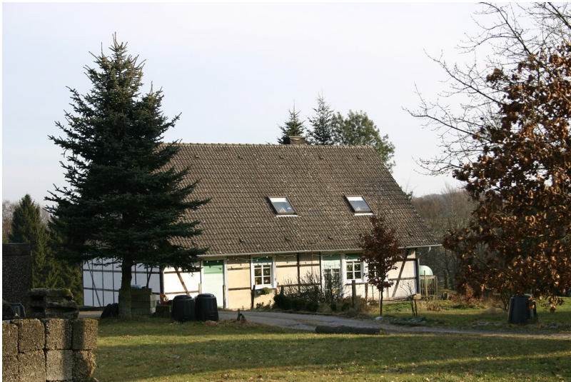
Das Fachwerkgebäude in Im Walde wurde zwischen 1840 und 1870 errichtet (2008).