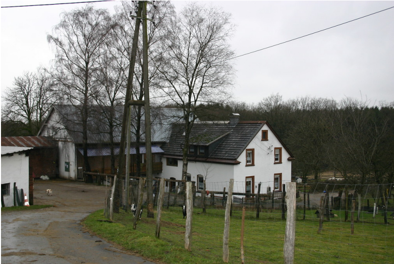
Landwirtschaftlicher Hof Birken (2008)