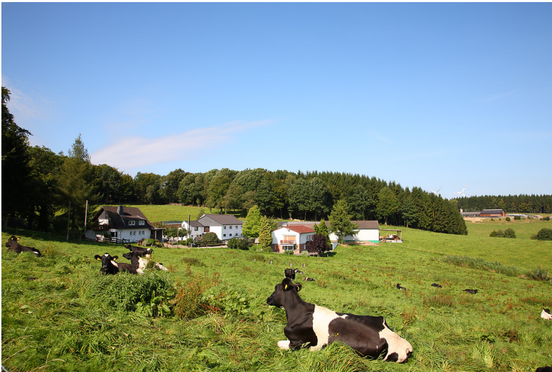
Beck aus südlicher Richtung (2008)