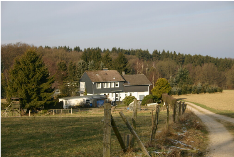
Blick auf Böhlefeldshaus von Südosten (2008)