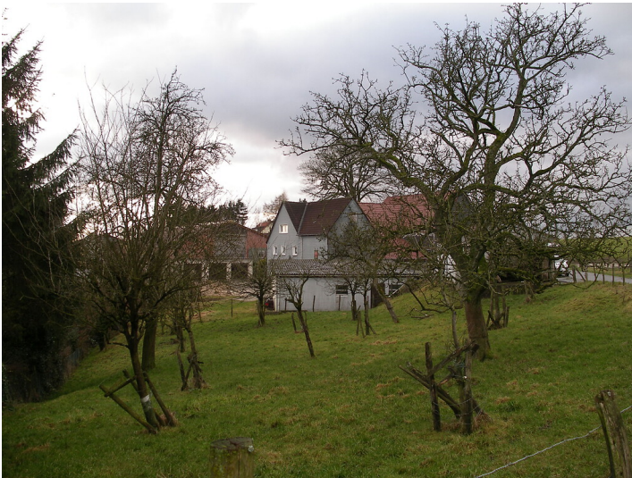
Nördliche Obstwiese in Altenhof (2008)