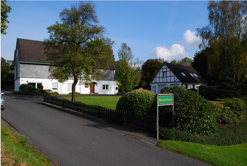
Westlicher Ortseingang von Neuenhaus (2008)