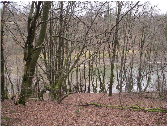
Durchgewachsene Buchenhecken im Wald weisen auf die ehemalige Siedlung Mühlenberg (2008)