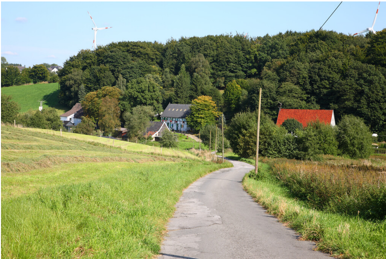
Milspe und Umgebung von Westen (2008)