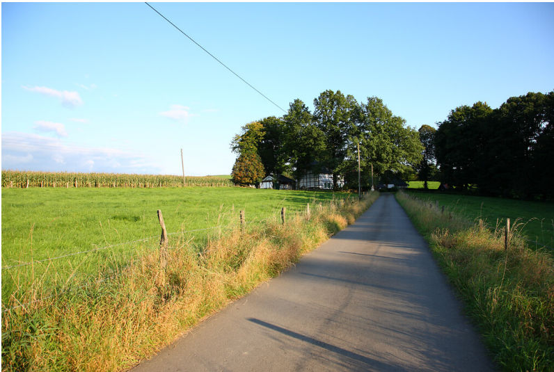
Blick auf Lorenzhaus von Nordwesten (2008)