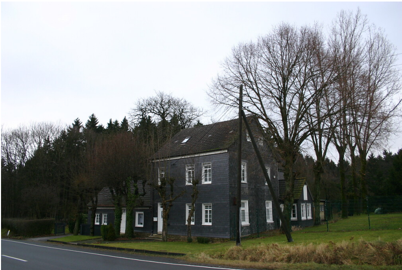
Mit Schiefer verkleidetes und von Hausbäumen umgebenes Wohnhaus in Landwehr (2008)