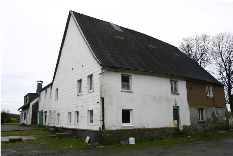
Historisches Wohnstallhaus in der Einzelsiedlung Kronenberg (2008)