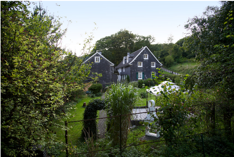
Siedlung und Gartenwirtschaft Krebsögersteg (2008)