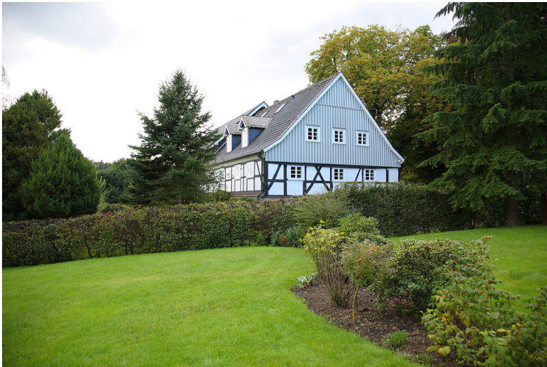
Fachwerkwohnhaus mit verbrettertem Giebel in Kräwinkel (2008)