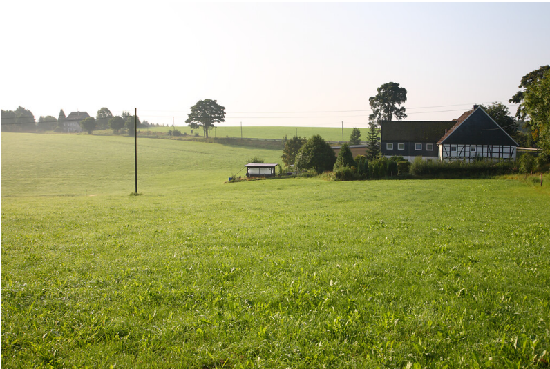
Blick auf Kettlershaus von Norden (2008)