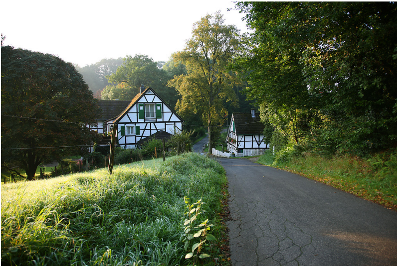
Fachwerkgebäude in Kaffekanne (2008)