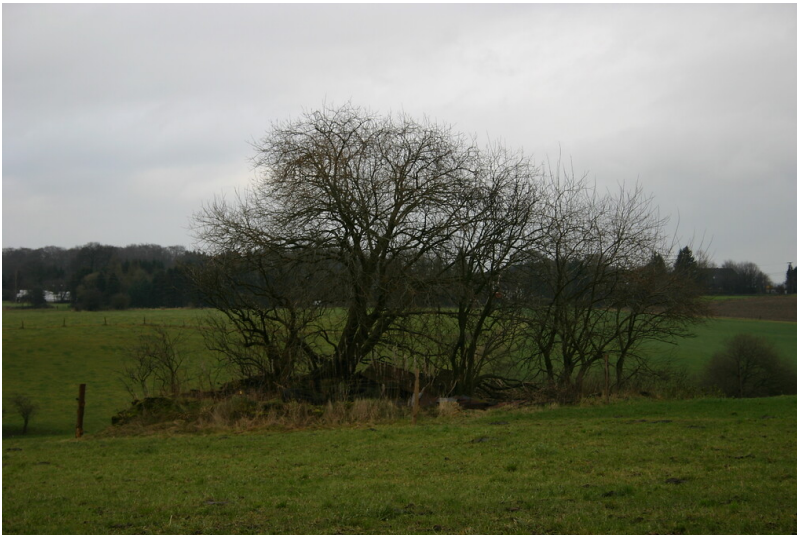
Wüstung Husmecke bei Filderheide (2008)