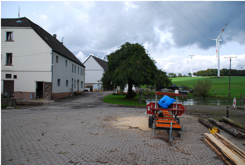
Hof auf historischem Standort in Harbeck (2008)