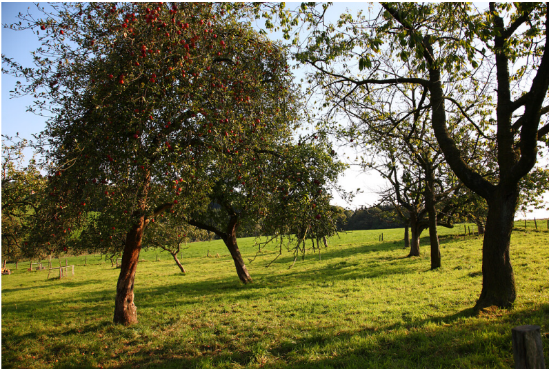
Obstwiese in Fuhr (2008)