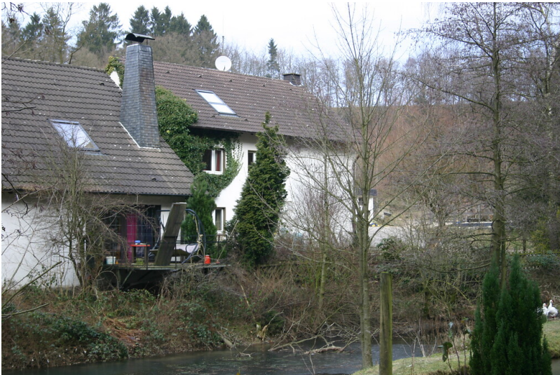
Der Gebäudebestand in Felsenbeck wurde modernisiert (2008)