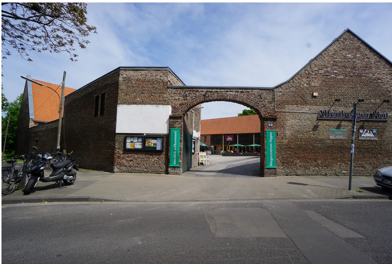
Eingang zum Altenberger Hof (2018)