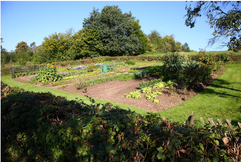
Bauerngarten in Oberlangenberg (2008)