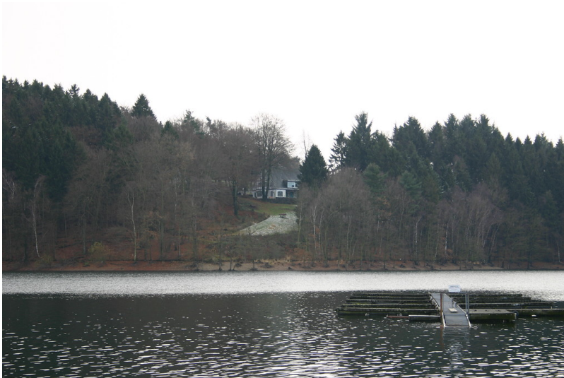
Blick auf Haus Uhlenhorst an der Bevertalsperre (2007)