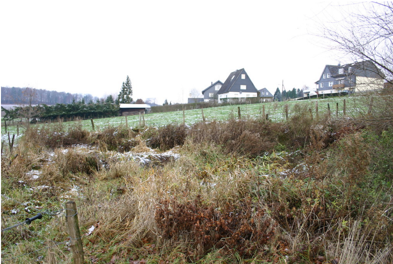
Standort des ehemaligen Teiches in Fürweg (2007)