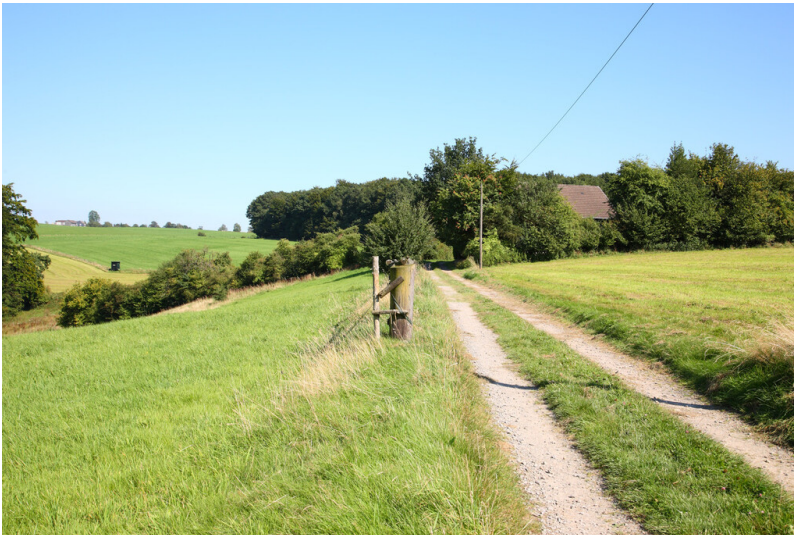
Der Einzelhof Böckel ist von einer Weißdornhecke umgeben (2008)