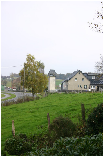
Weidefläche, Transformatorenhaus und Wohnhaus in Straßburg (2007)