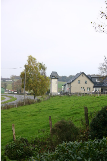
Weidefläche, Transformatorenhaus und Wohnhaus in Straßburg (2007)