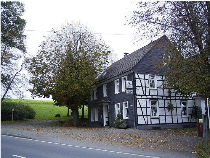
Gastwirtschaft mit Hausbaum in Grünestraße (2007)