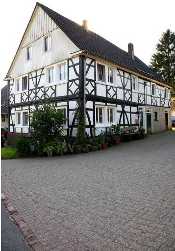
Denkmalgeschütztes Fachwerkgebäude in Vogelsholl (2008)