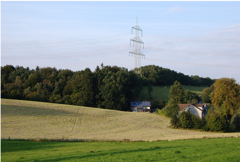
Sohl inmitten von Ackerland, Grünland und Wald (2008)