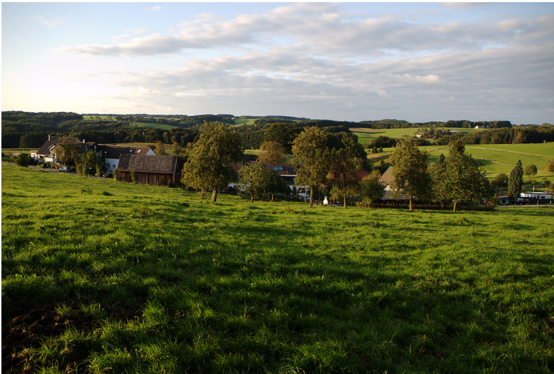
Blick auf Bockhacken mit der Obstweide im Vordergrund (2008)