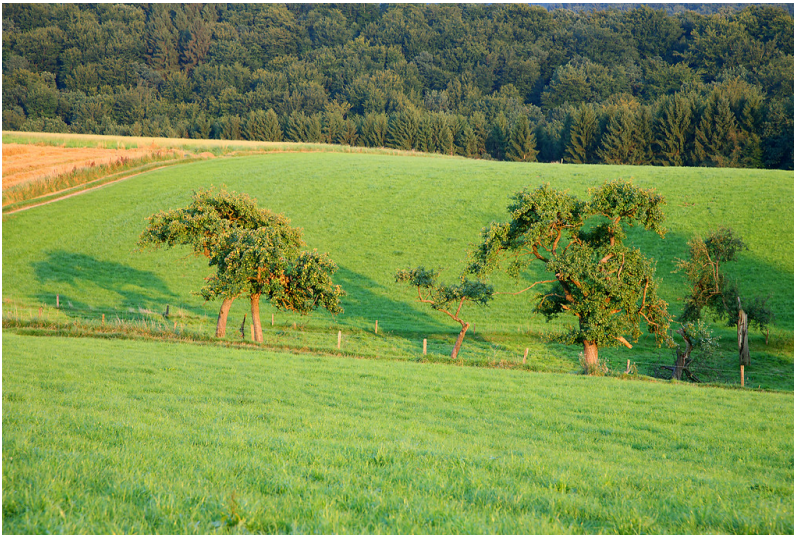
Obstwiese bei Niederburghof (2008)