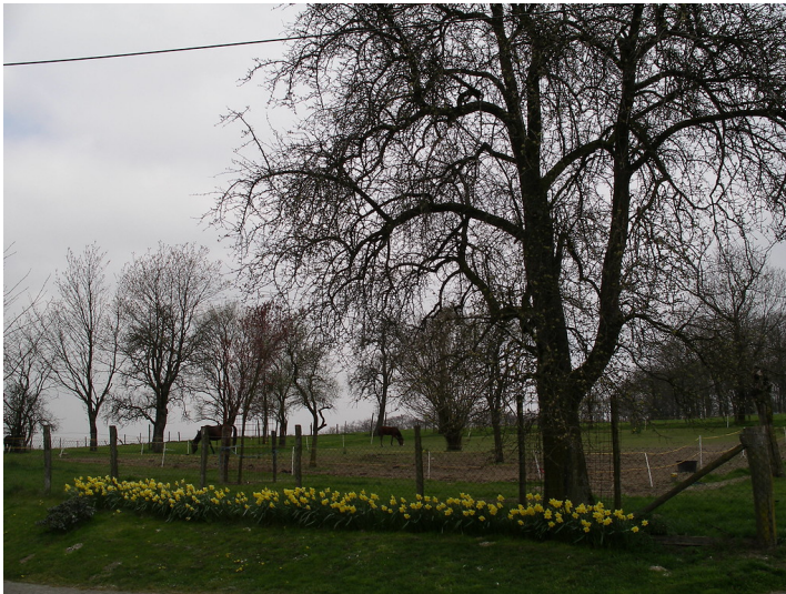
Obstweide in Oberburghof (2007)