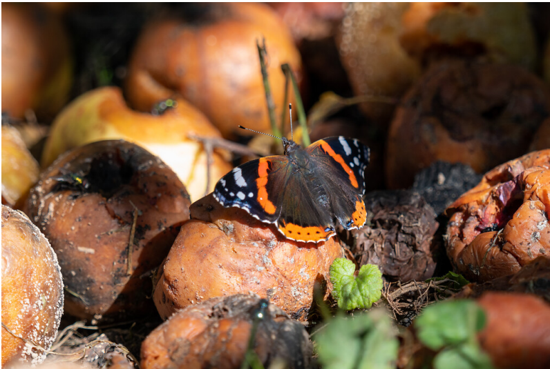
Admiralfalter auf Fallobst