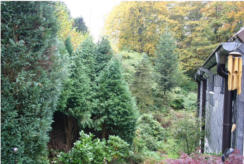
Steinbruch in der Siedlung Straßburg (2007)