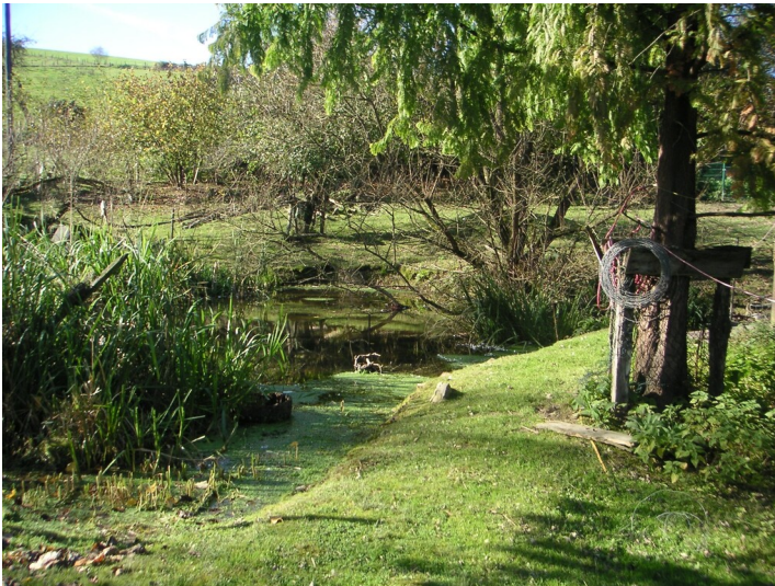
Löschteich von Kleinkatern (2007)