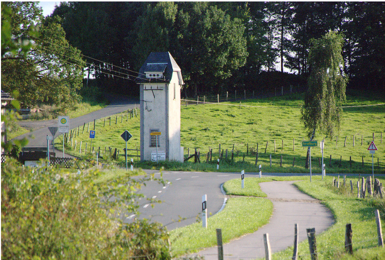
Transformatorenhäuschen mit Weideland und Baumgruppen in Straßburg (2008)