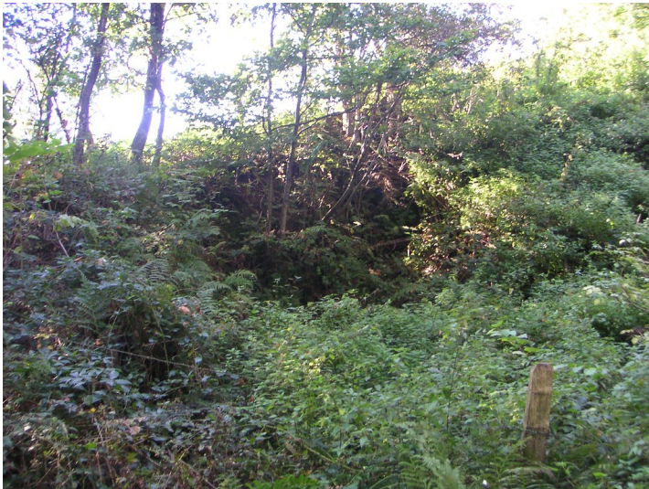
Steinbruch bei Hambüchen (2007)