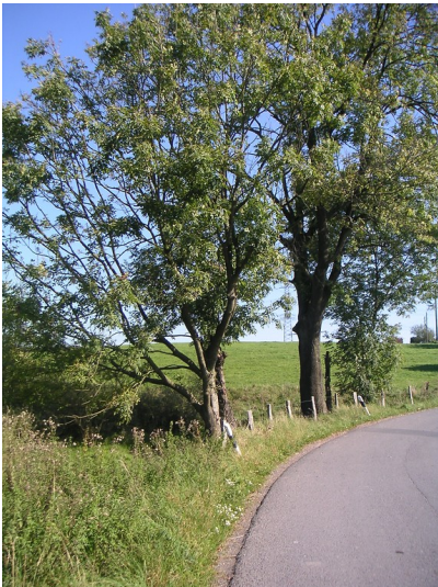
Ehemaliger Löschteich bei Kleinenscheidt (2007)