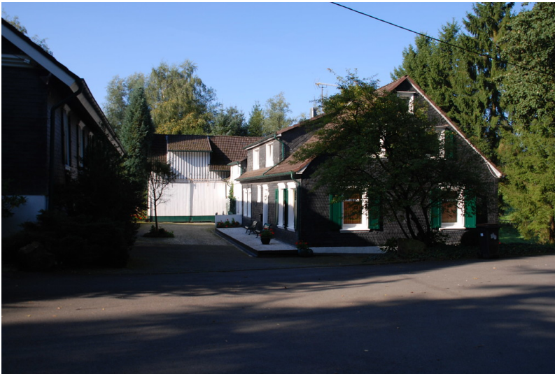
Historisches Wohngebäude in Dörpersteeg (2008)